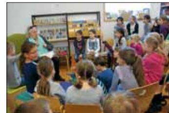
Alle waren mit Feuereifer dabei.

Ende April, zum „Welttag des Buches“, veranstaltete die Kinder- und Jugendbücherei zusammen mit der Breitwiesenschule die alljährlichen Vorlesetage. An zwei Vormittagen kam jede Klasse der Grundschule in den Genuss einer ganz speziellen Vorlesestunde in der Bücherei.